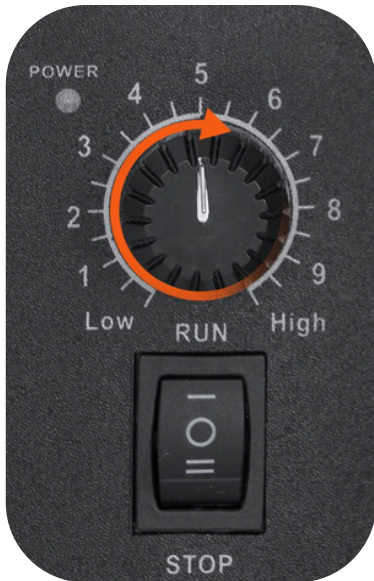
CONTROL DE VELOCIDAD